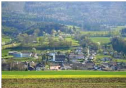
▣ Mikroregion Haute Sorne