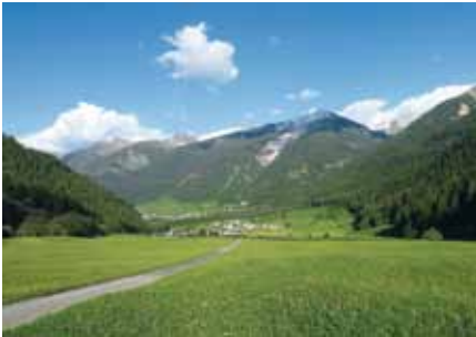
▣ Val Müstair

(t/a) und 4500 t/a Rindermist bot eine gute Ausgangslage, um eine Biogasanlage zu betreiben. Eine ganze Talschaft sollte mit Ökostrom und Wärme aus ökologischer Produktion versorgt werden. Eine Biogasanlage mit Hofdünger von mehreren Betrieben ist logistisch aufwändig und teuer, da sie viel Lagerkapazität benötigt. Weil die Bauern vertraglich nicht zuseichern konnten, Dünger dauerhaft zu liefern, entschloss man sich, das Projekt abzubrechen.