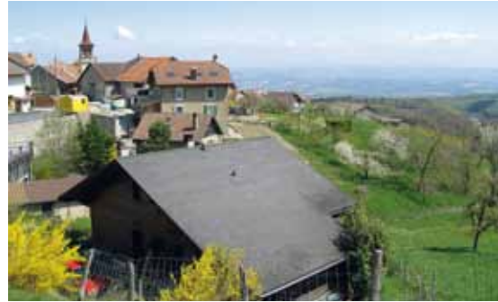
Region Vallon du Nozon