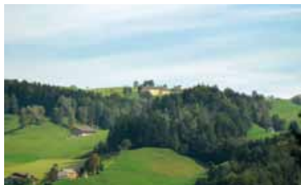
▣ Modellstall in Appenzell I.Rh.