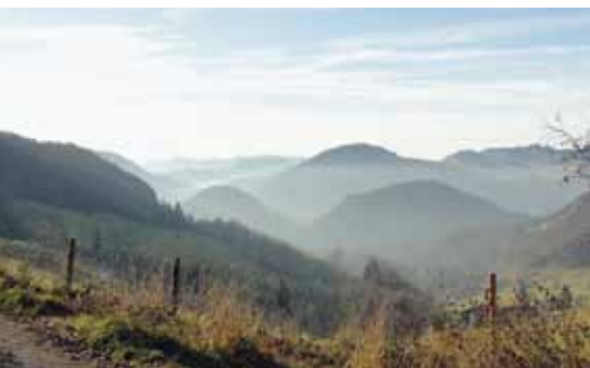
📍 Belchen-Passwang: Chilchzimmersattel

terbinden? Was ist überhaupt Landschaftsqualität? Unter Beteiligung lokaler, regionaler und nationaler Interessensgruppen und Politikbereiche wurde ein Raumkonzept für das Gebiet Belchen-Passwang entwickelt. Dieses schlägt funktionale Teilräume mit differenzierten Schutz- und Entwicklungsszenarien auf kantonaler Ebene vor, wie sie das Gebiet, welches im Bundesinventar der Landschaften und Naturdenkmäler von nationaler Bedeutung (BLN) aufgeführt ist, in den nächsten Jahrzehnten prägen könnte.