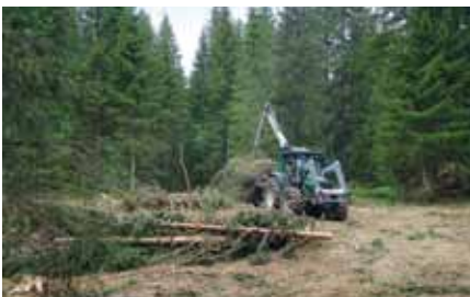
▣ Neuenburger Berge

ter welchen Bedingungen das Holz in den Waldweiden welchen Anteil an Holzenergie bereitstellen kann und auf welche Probleme man am häufigsten trifft. Die Ergebnisse ermöglichen es, Menge und Kosten dieser Energie zu beziffern. Die entwickelte und getestete Methodik wurde in den Neuenburger Bergen getestet, ist jedoch auch in anderen Regionen anwendbar.