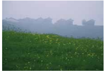
▣ Walsersiedlung Medergen